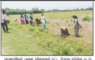
மாணவிகள் பணை விதைகள் நடட்ட போது எடுத்த படம்.